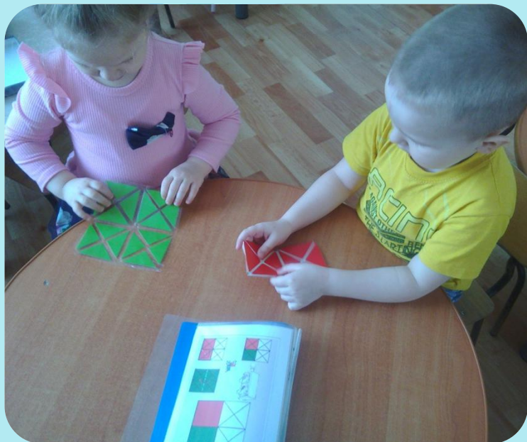
Работа со схемой