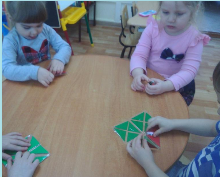
Игровое взаимодействие без участия взрослого