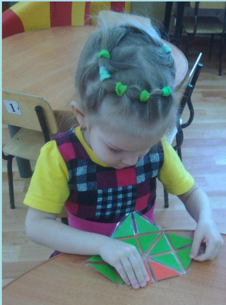
Создание объемной фигуры