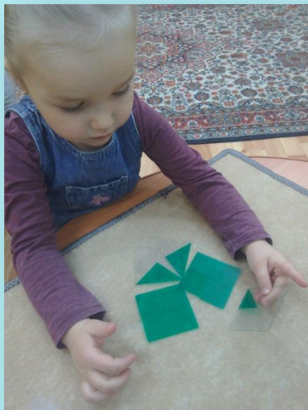
Работа по алгоритму