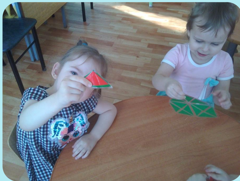
Придумывание собственных образов