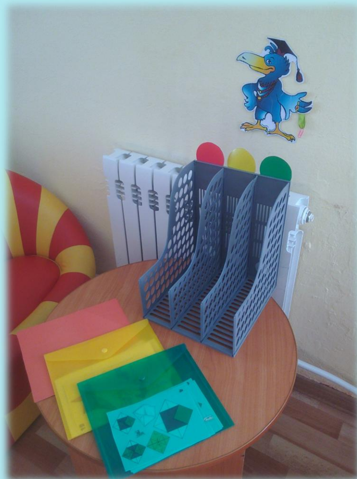
Маркер - Ворон Метр