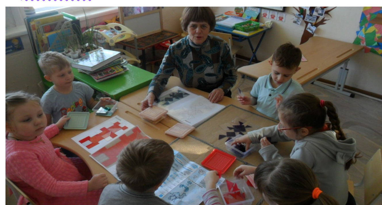
Командная работа— моделирование плоскостных фигур для театра с помощью конструктора «Прозрачный квадрат»