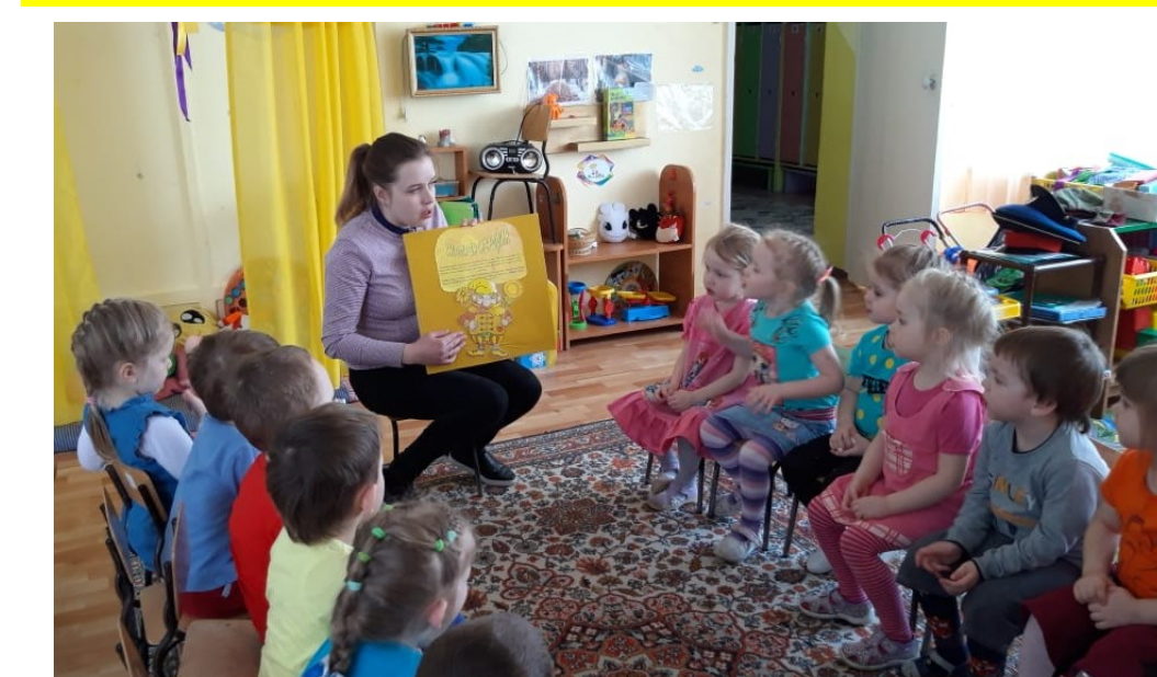
Организация совместной образовательной деятельности взрослого и ребенка посредством лепбук «Разноцветные истории»