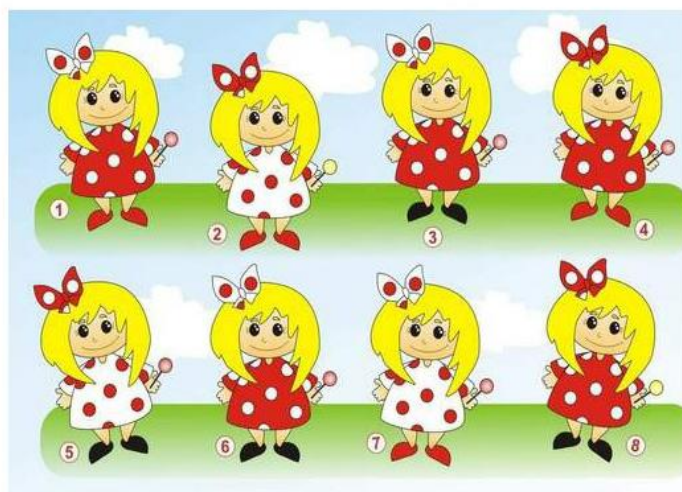
Найди два одинаковых девочек.